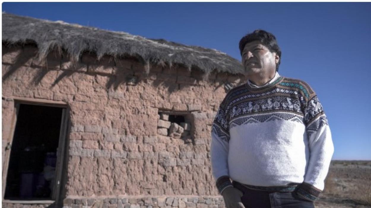
Evo Morales, il primo presidente indigeno della Bolivia.

L'anteprima di Seremos millones, documentario su Evo Morales, inaugura la manifestazione. Al via 9 giorni di cinema con 102 opere provenienti da America Latina, Spagna, Portogallo e Italia.